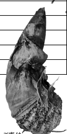
ご寄付 いただきました!